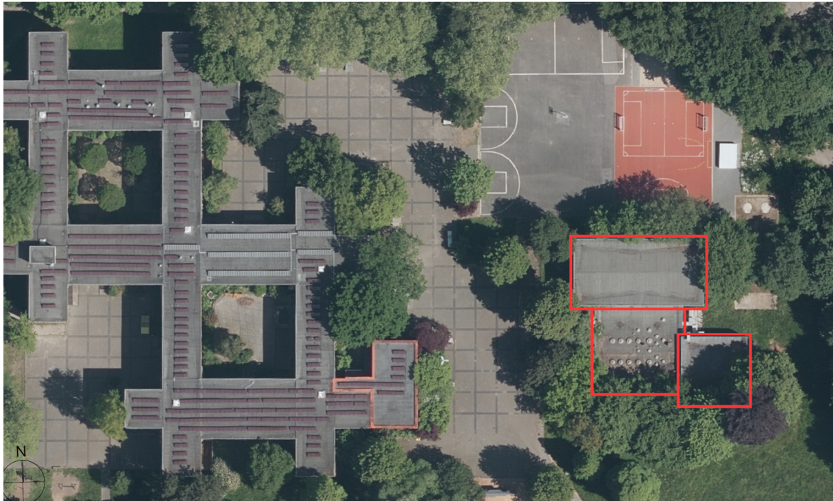
Abbildung 2: Luftbild auf das Grundstück